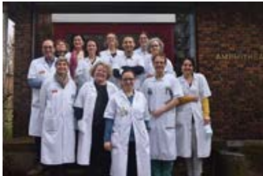
Hôpital Beaujon-Equipe en charge de l'étude RIPORT

Cent onze patients ont participé à l'étude. Il s'agissait en majorité d'hommes (56%) avec un âge médian de 50 ans. Au moment du début de l'étude, plus de 70% des patients recevaient un traitement anticoagulant par antivitamine K (exemple coumadine ou préviscan). La thrombose était étendue dans et à l'extérieur du foie pour plus de la moitié des patients et un tiers avaient des varices dans l'œsophage. Après tirage au sort, 56 recevaient un traitement par xarelto 15, et 55 ne recevaient pas de traitement anticoagulant.