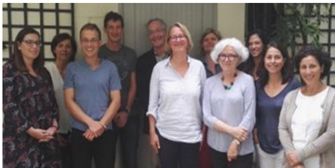
Équipe du réseau français des maladies vasculaires du foie

Coordinatrice du centre de référence des maladies vasculaires du foie – Beaujon.