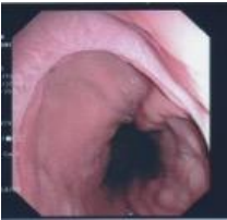
Vue endoscopique d'un œsophage avec varices.

L'œsophage est le tube souple conduisant les aliments de la bouche à l'estomac, dans le cou et le thorax. Les varices, qu'elles se forment dans les jambes ou dans l'œsophage, sont des veines dilatées de façon irrégulière et à la paroi amincie. Celles des jambes, banales, visibles, et donc connues de tous, se développent sous la peau. Celles de l'œsophage, invisibles de l'extérieur, se développent sous le revêtement du tube digestif en contact avec les aliments. Ce revêtement est appelé la muqueuse. Les varices sont dans la paroi même de l'œsophage, entre la muqueuse et les muscles qui forment la paroi plus extérieure de l'œsophage. La contraction de ces muscles est chargée de faire descendre les aliments.